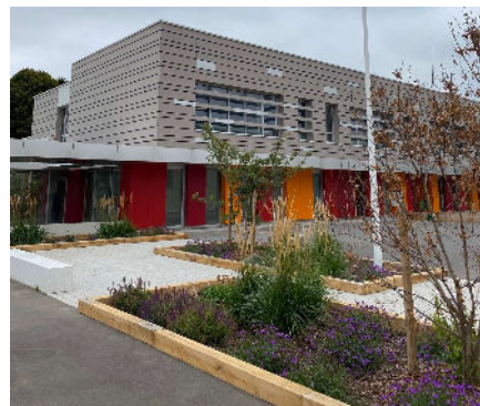
Ecole élémentaire, Louches TAO architecte Rénovation