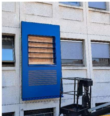
IUT Gratte-Ciel Villeurbanne – SUPER MIX