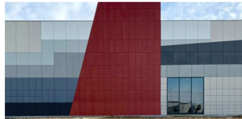
Rénovation maisons Camus – Red CAT & BLAU