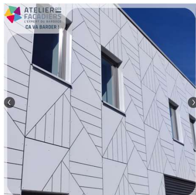
Marcq-en Baroeul Rénovation bureau D'houndt + Bajard