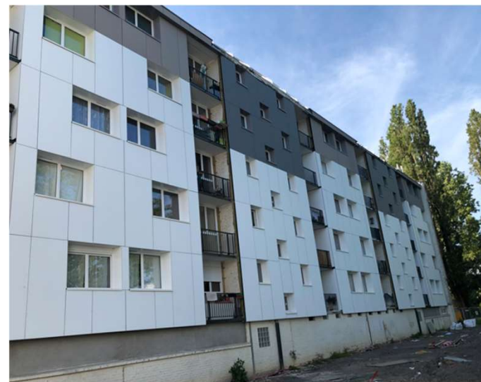
Offenbach, Villeneuve d'Ascq Rénovation