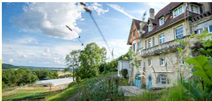
L'Hermitage - L'Hermitage, semons les champs des possibles (hermitagelelab.com)

L'implantation des différents espaces est réfléchi de façon à ce que ceux-ci soient modulables et adaptables en fonction des expérimentations et des projets, tout en tenant compte des spécificités du terrain et de l'écosystème. Différents espaces, traitant de thématiques variées, tels que les jardins, le théâtre de verdure, le plateau (marché de producteurs), les chalets (bibliothèque et expositions) ou encore le hameau et ses ateliers.