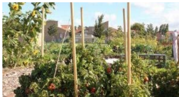
Alimentation - Mairie de Grande-Synthe (ville-grande-synthe.fr)

Lieu : Grande-Synthe (59) Date de livraison : 2020 Maitrise d'ouvrage : Mairie de Grande-Synthe Mots clés : agriculture biologique / filière courte / alimentation