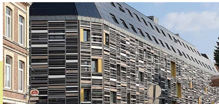
La Catho «LE RIZOMM» Lille (59) - Moduo

Le Rizomm est un bâtiment atteignant le niveau BEPOS, en capacité de produire, d'autoconsommer et de mutualiser l'énergie, tout en permettant aux usagers de maîtriser leur confort thermique. Pour atteindre ce niveau de performance, les murs sont isolés par l'extérieur avec un bardage en terre cuite, des brise-soleils en terre cuite afin de limiter les apports solaires directs en été, un système de ventilation avec récupération d'énergie, une étanchéité à l'air renforcée ainsi que 1200 m 2 de panneaux photovoltaïques.