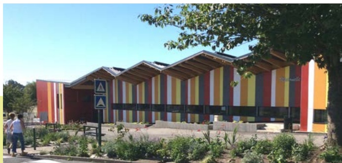
Groupe scolaire Jules Ferry

Pour réaliser ce bâtiment respirant, la solution retenue est une ventilation naturelle activée (VNA), assurant un renouvellement d'air continu, en lien avec le manteau dynamique climatique. Ce manteau se base sur un système de préfabrication, les parois opaques du bâtiment ayant été isolées par des caissons bois/paille afin de minimiser les déperditions d'énergie. Ce système permet d'assurer un bon confort intérieur en été, la paille stockant la chaleur avant de la diffuser quinze heures plus tard. Des fenêtres pariétodynamiques sont installées, chauffant l'air en hiver et le refroidissant en été.