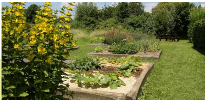
Le blog du Jardin de Chlorophylle: L'été au jardin de chlorophylle

Autour d'une maison bioclimatique, construite avec des matériaux biologiques, se trouvent différents éléments favorisant la préservation de la biodiversité : mares, potagers, ruches, volières, etc. La sensibilisation du public se poursuit à travers des ateliers sur l'entretien des espaces verts, le jardinage écologique, l'éco-consommation ou encore la formation.