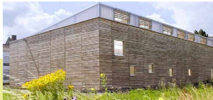
Maison du projet de la Lainière

La construction a ainsi été réalisée afin que tous les matériaux puissent être réutilisés. Le choix s'est porté sur des matériaux biologiques, sans ajout de produits chimiques (donc non toxiques pour les usagers) pour une réincorporation dans les cycles naturels.