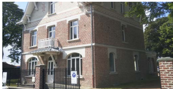
La maison de l'ingénieur - Réhafutur 1

Lieu : Loos-en-Gohelle (62) Date de livraison : 2015 Maitrise d'ouvrage : Maisons & Cités Mots clés : matériaux biosourcés / confort d'été / VMC double flux / capteurs