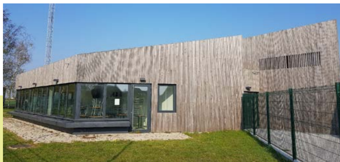
Autoconsommation collective photovoltaïque pour la commune de Rexpoëde

Ces systèmes permettent d'assurer les besoins en consommation électrique et en eau chaude sanitaire des deux équipements, grâce notamment à la mise en place d'un stockage de l'énergie via une batterie plomb acide.