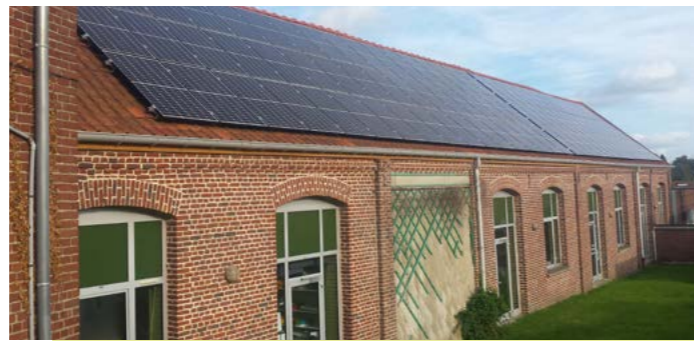
Autoconsommation collective photovoltaïque pour la commune de Burbure

Lieu : Burbure (62) Date de livraison : 2020 Maîtrise d'ouvrage : Mairie de Burbure Mots clés : autoconsommation collective / solaire photovoltaïque