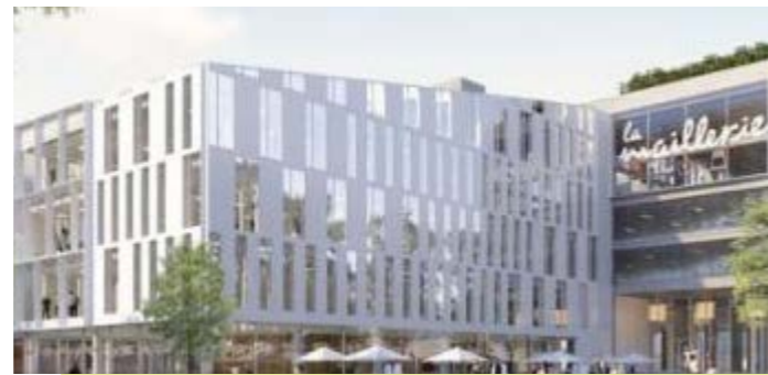
LES BUREAUX DE LA MAILLERIE | NFC (fayat.com)

Lieu : Villeneuve-d'Ascq (59) Date de livraison : 2024 (début du projet en 2018) Maîtrise d'ouvrage : Linkcity Nord-Est et Nhood France Mots clés : réemploi / ACV / impact environnemental / gestion des ressources