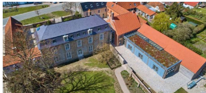
La Maison du Parc | Le Wast (62)

Lieu : Le Wast (62) Date de livraison : 2021 Maitrise d'ouvrage : Parc naturel régional des Caps et Marais d'Opale Mots clés : BBC / écomatériaux / phytoépuration